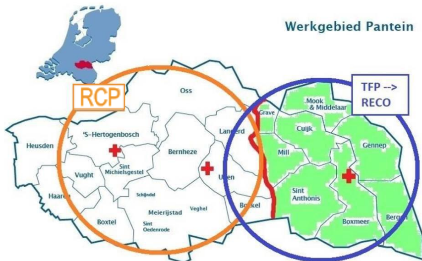
Bijlage 1: Definitie subregio's Noordoost-Brabant